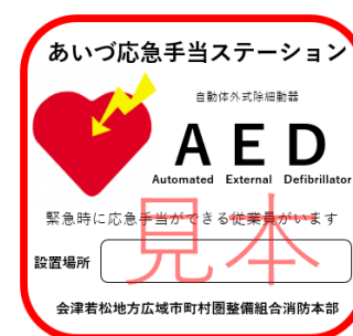
応急手当ステーション